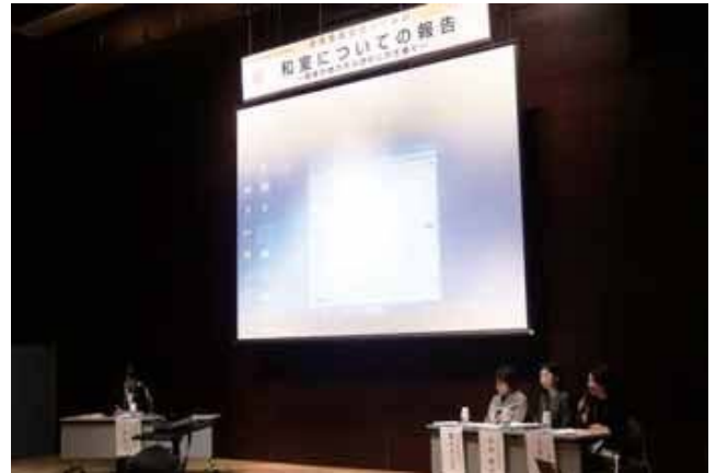
女性委員会セッションイメージ

活かしていくこと、さらに一般の方々にも全国各地に現存する貴重な建築の魅力を広めることを目的としています。制作を記念するトークイベントを行い、あらためて和の空間の魅力を探ります。