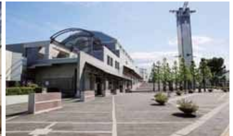
さいたま芸術劇場*