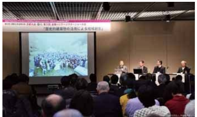
全国ヘリテージマネージャー大会イメージ

このように歴史的建造物の保存活用に向けた仕組みが進化し、かつ深化しています。この大きな動きの中で、HMの真価が問われている時代になったと思われます。本大会では、この時代の中でHMの役割を議論し、さらにこれからのHMの活動を展望し、私たちHM自身が自覚し行動していく機会にしたいと考えています。