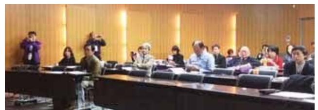
環境部会セッションイメージ