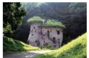
あけぼの子ども森公園