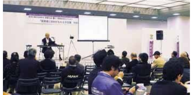
情報部会セッションイメージ

が可能になりました。欧米やシンガポールなどでは確認申請にBIMのモデルデータを活用した審査が実施されていると聞きます。電子申請の動きに合わせて、われわれの業務環境は大きく変化すると予想されます。本セッションでは、民間確認検査機関における確認申請電子化の動向とその手続き、2016年8月に国内初のBIMデータを使用した建築確認申請手続きによる4号建築物の確認済証交付を実現した発表、そして海外でのBIM確認申請の状況を学び、建築士の情報化につながる場としたいと考えています。