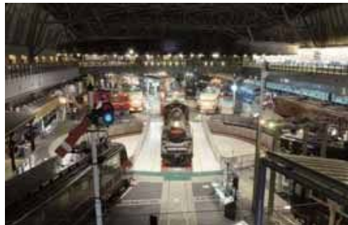
鉄道博物館

また、氷川神社参拝後は、いまも名品盆栽の聖地として知られ、日本だけでなく世界から多くの愛好家が訪れている盆栽村と日本および世界の鉄道に関する遺産・資料に加え、国鉄改革やJR東日本に関する資料を体系的に保存する鉄道博物館へご案内いたします。