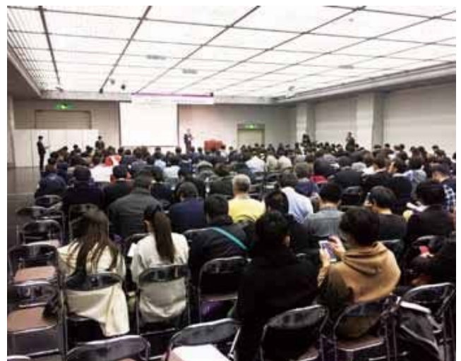
青年委員会セッションイメージ