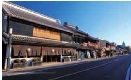
川越伝建地区のまちなみ