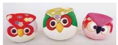
木目込みふくろう