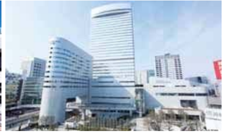
大宮ソニックシティ・パレスホテル大宮*