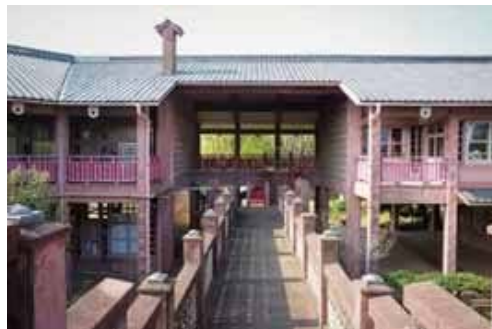
宮代町立笠原小学校