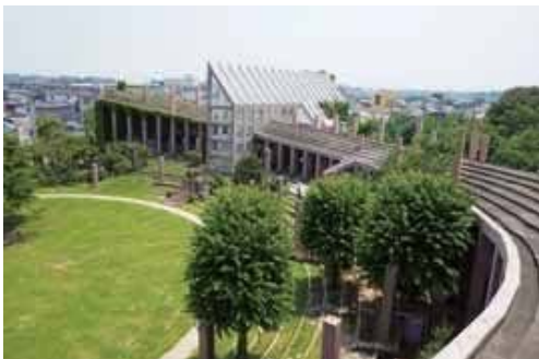
コミュニティセンター進修館

これらの建築を見ていただくことで、建築が竣工してから年月を経て、人とともに生きる過程を感じつつ、建築の今と未来を考えていただく機会となればと思います。