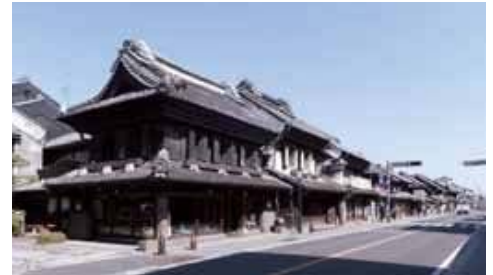
蔵のまちなみ