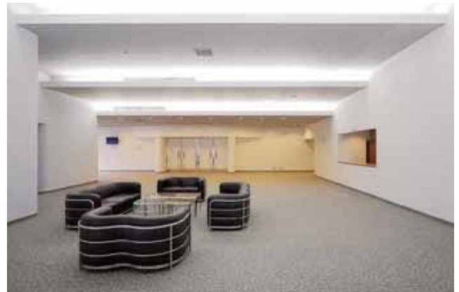
国際会議室ロビー