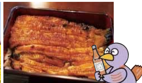
浦和といえぼうなぎ