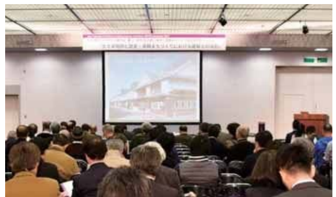
街中(空き家)まちづくり部会セッションイメージ

そして本年度には、大阪府、兵庫県、奈良県などの建築士会が講習を行うこととなっています。また、2017年度に奈良県建築士会が「空き家等対策に関するシンポジウム」を開催されています。