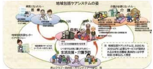
地域包括ケアシステムの姿

とはいえ、地域包括ケアシステムはすでに基本的な形ができており、建築士(会)からの目線だけではスムーズに受け入れられないとされます。そこで、地域包括ケアシステムやその拠点となる地域包括支援センターのことを知り、建築士に何が求められ、そのために何をすべきかを学び話し合える貴重な機会にできたらと思います。