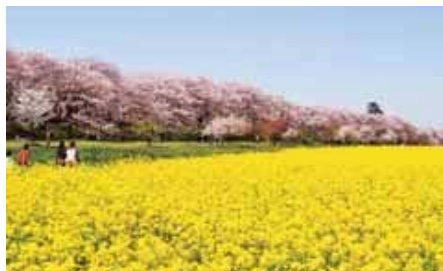
権現堂堤の桜・菜の花(幸手市)