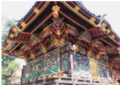
妻沼歎喜院聖天宮