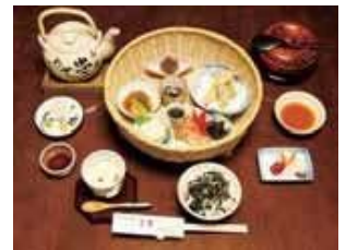
忠七めし(内容は季節で変わります)