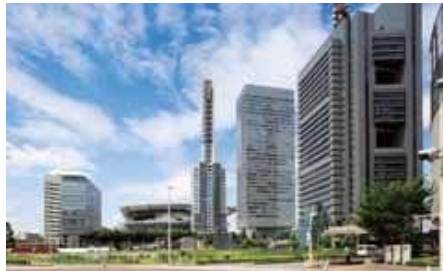
さいたま新都心のまちなみ*