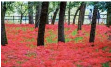
巾着田の曼珠沙華(日高市)