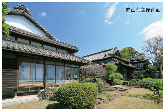
的の山荘主屋南面